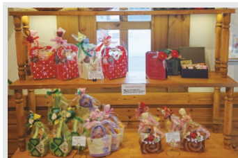
③ 内装 (陳列棚など)