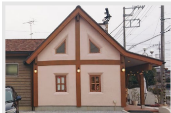
② 側面 (片方のみ)