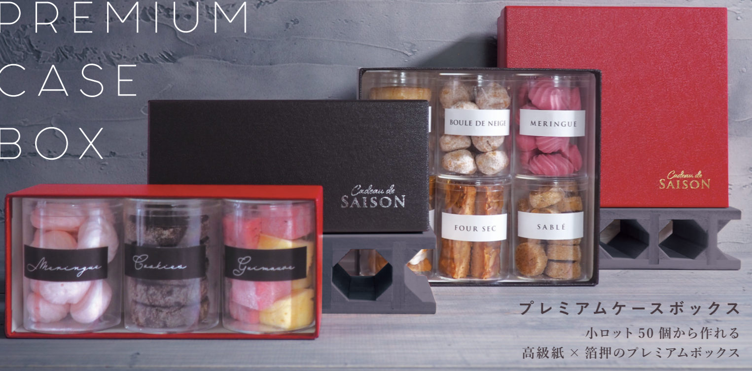
プレミアムケースボックス 小ロット 50 個から作れる 高級紙 × 箔押のプレミアムボックス