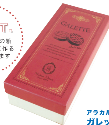
アラカルトボックス ガレット