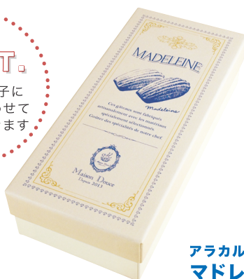
アラカルトボックス マドレーヌ