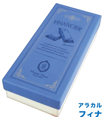
アラカルトボックス フィナンシェ

ロット：1ケース50個入り / サイズ：95×220×50Hmm (内寸) 焼菓子6~8個向け / 製造納期：3~5週間 販売価格：ロット50個単位 ¥298 ● ロット100個単位 ¥270