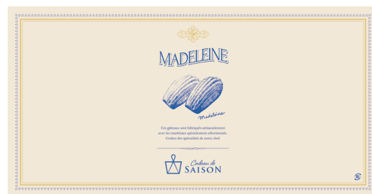
アラカルト掛紙 マドレーヌ