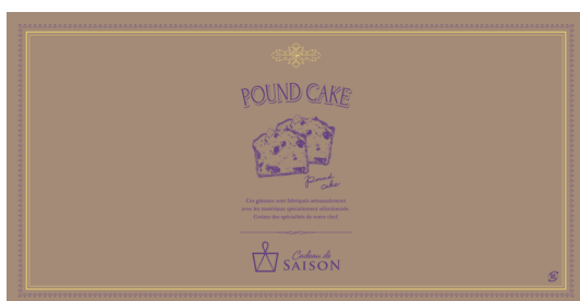
アラカルト掛紙 パウンドケーキ