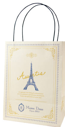
アラカルトバッグ エッフェル