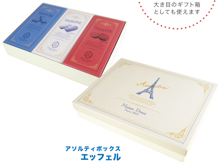
アソルティボックス エッフェル