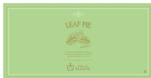
アラカルト掛紙 リーフパイ