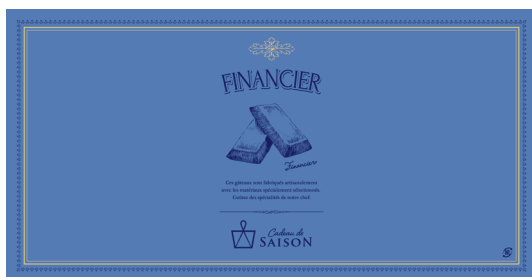
アラカルト掛紙 フィナンシェ