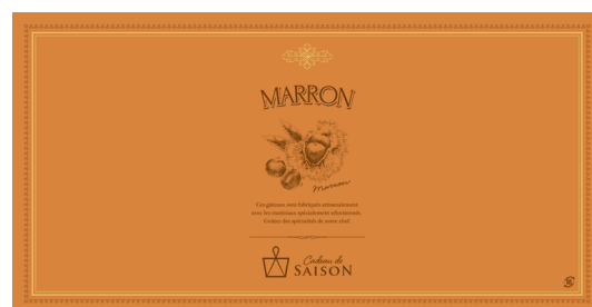
アラカルト掛紙 マロン