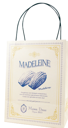
アラカルトバッグ マドレーヌ

※2種類以上であれば、100枚ずつの単位で種類違いでも 製造できます。(単価は¥180となります。)